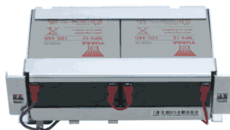
Notstromversorgung für 2 Stunden