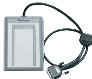
Abgesetzte Alarmeinheit mit Zonenanzeige, max. Kabellänge 60m